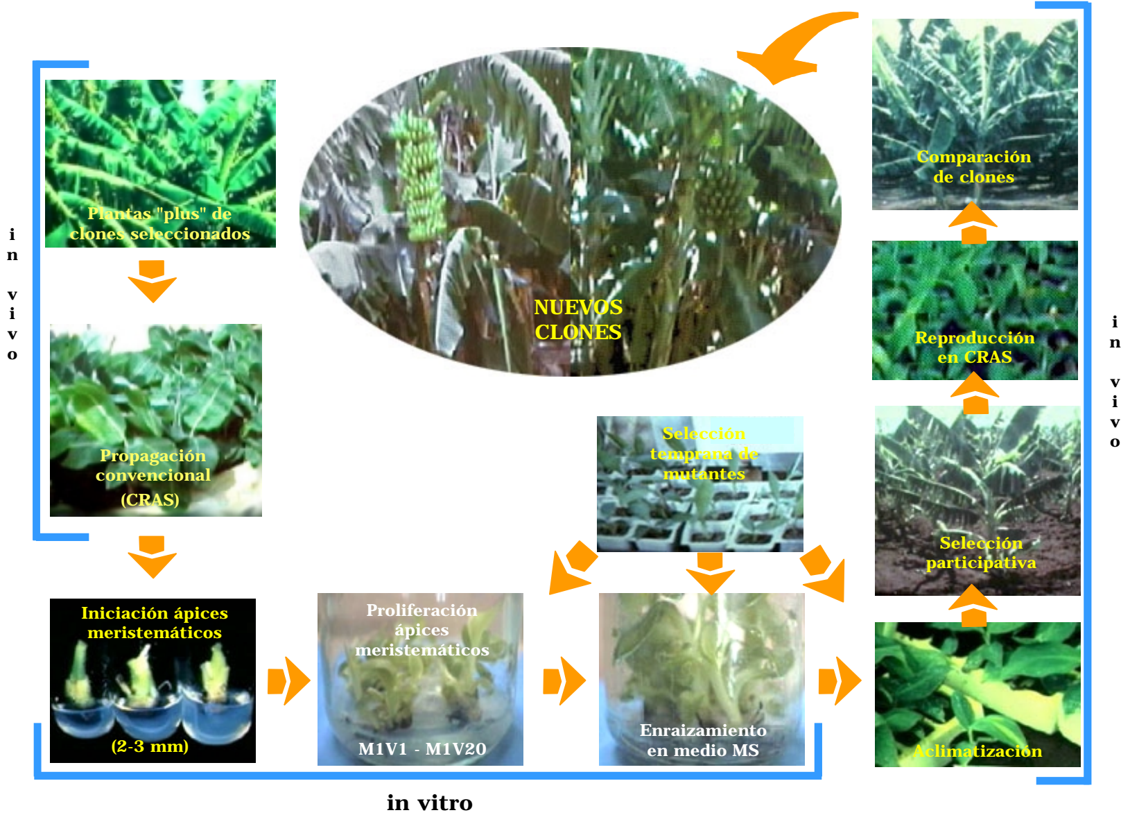
Figura 2. Pasos en la inducción de la variación somaclonal.